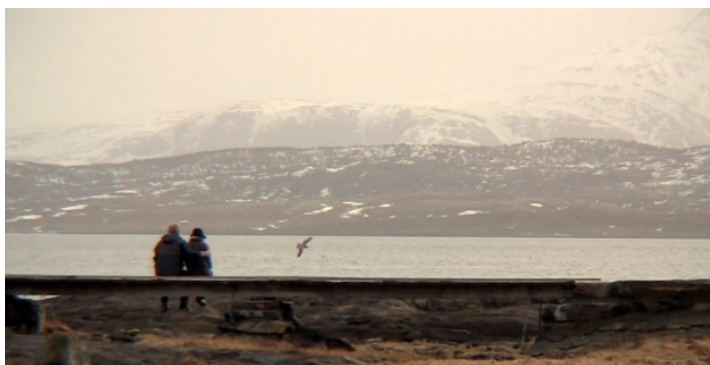
Stillebilde fra filmen "On Shore" som ble laget på Barents Youth Film Festival 2011